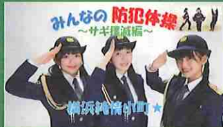
みんなの防犯体操 ～サギ撲滅編～