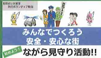
始めよう! ながら見守り活動!!