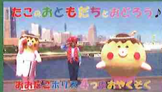
たこのおともだちとおどろろ♪ おおだこポリス4つのおやくそく